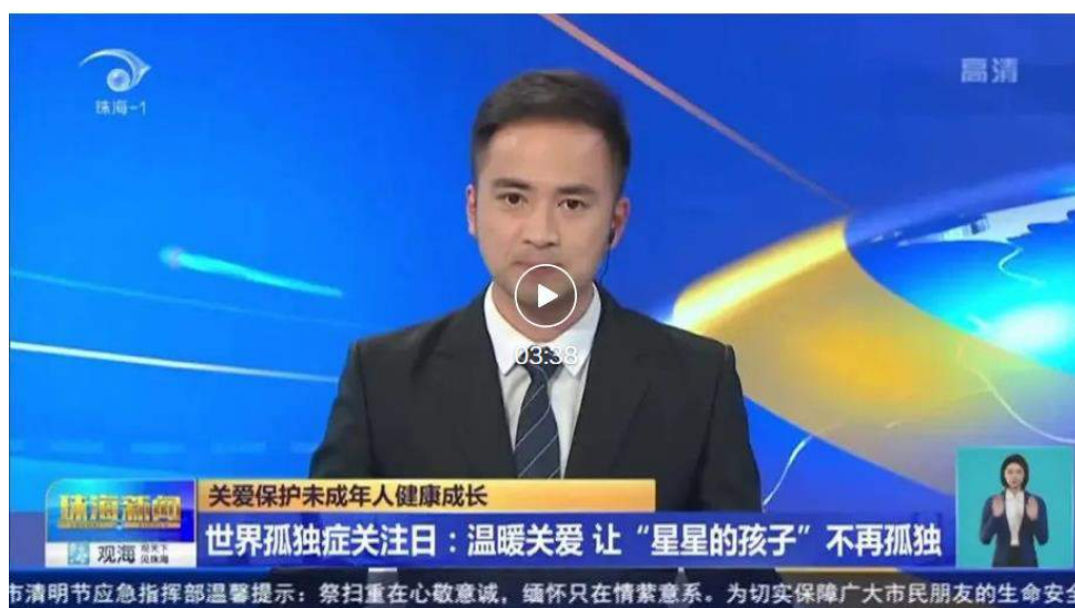
《珠海新聞》報導珠海奧園廣場「孤獨症關注日」專題活動

其中浦北奧園廣場攜手場內商戶拍攝短視頻給「來自星星的孩子」送上關愛，而珠海奧園廣場開展了「星星兒童藝術作品展」，吸引了多家媒體聚焦報導和眾多市民駐足觀看，讓更多市民對孤獨症的孩子們有了更深的瞭解，讓愛在溫暖中傳遞。